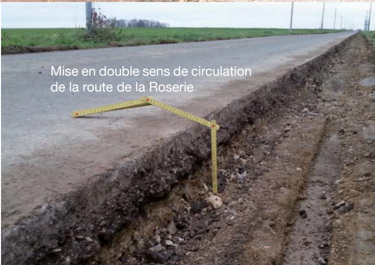
Mise en double sens de circulation de la route de la Roserie

Comme cela avait été demandé par un grand nombre de personnes, les travaux de voirie et de sécurité ont été mis en oeuvre en ce début d'année 2016. Pour certains de nos concitoyens, il a fallu changer certaines habitudes de conduite lors de la traversée du village. Après quelques ajustements, la signalisation a permis de réduire considérablement les vitesses dans le village.