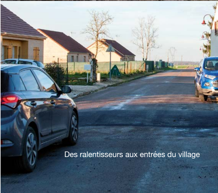
Des ralentisseurs aux entrées du village