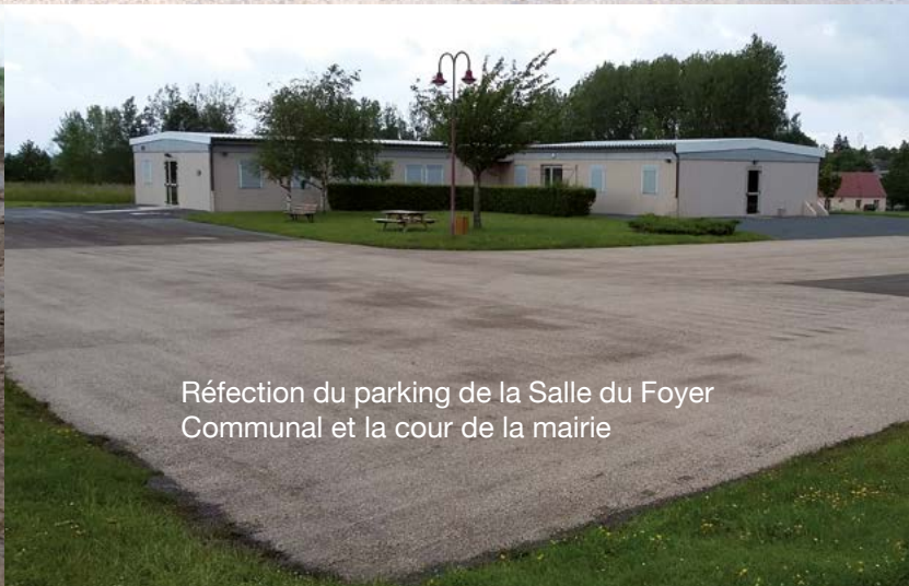
Réfection du parking de la Salle du Foyer Communal et la cour de la mairie