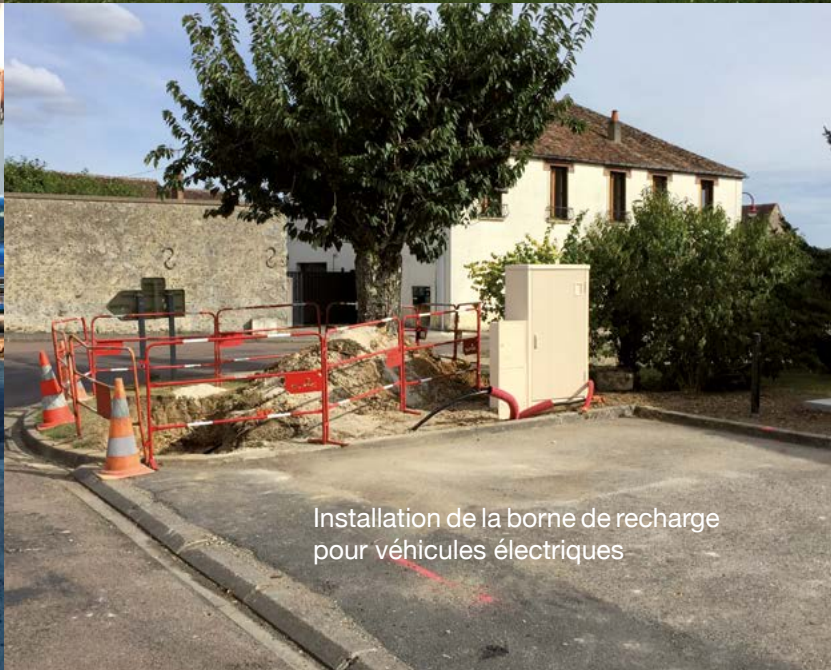
Installation de la borne de recharge pour véhicules électriques